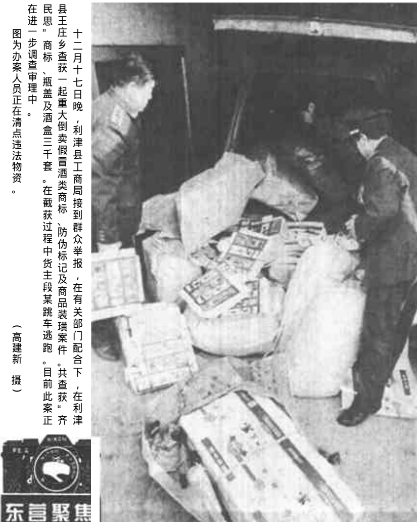
十二月十七日晚，利津县工商局接到群众举报，在有关部门配合下，在利津县王庄乡查获一起重大倒卖假冒酒类类商标、防伪标识及商品装璜案件。共查获“齐民思”商标、瓶塞及酒盒三千套。在查获过程中，部分人员正在清点违法物资。

本报讯 从11月21日开始，我市交通秩序集中整治全面展开。这次活动以抓秩序，防事故，保畅通为主要内容，集中整治无证驾车、无牌上路、超速超载等严重违法违章行为。 12月10日是交通整治中异地调防的第一天，全市各县区抽调干警、警车异地执勤。据执勤交警介绍，今年交通违章现象较去年已明显减少，驾驶员交通意识普遍增强，但酒后开车、无牌上路等违法现象仍不容忽视。 （本报记者 刘西光）